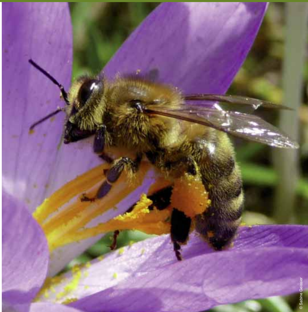
UNE ABEILLE TRANSPORTE sur une seule de ses pattes postérieures 500 000 grains de pollen.

Dans ce cadre, des scientifiques anglais et hollandais ont réussi à agréger les premiers indicateurs chiffrés fiables, en s'appuyant sur une longue tradition d'inventaires historiques de l'entomofaune, un suivi sur les trente dernières années et un réseau de citoyens qui participent aux observations (plus d'un million de données ont ainsi été collectées et examinées). Ils se sont intéressés aux populations d'abeilles sauvages solitaires et de syrphes, mouches qui ressemblent à des abeilles ou à des guêpes et qui peuvent avoir une activité pollinisatrice importante en particulier sous les faibles latitudes. Ce travail, publié dans Science en 2006, a mis en évidence un déclin à la fois de l'abondance et de la diversité des abeilles sauvages depuis 1980 dans 67 % des zones répertoriées au Royaume-Uni, ainsi que le déclin des plantes associées à ces pollinisateurs. Pour les syrphes, aucune tendance ne se dessine vraiment pour le Royaume-Uni, tandis qu'aux Pays-Bas, leur diversité progresse dans 34 % des zones étudiées. Les auteurs notent aussi dans ces deux pays une diminution de la quantité et de la diversité